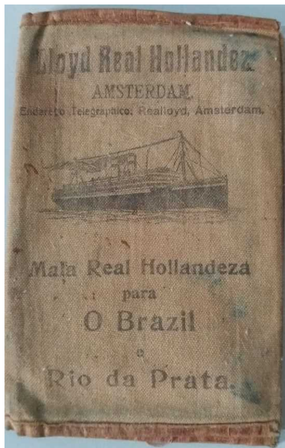
Foto 07 Passaporte para o Brasil, 1924, fornecida por Martin Korch.