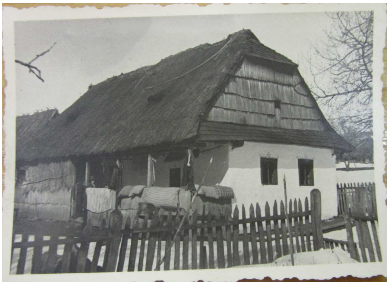
Foto 11 Casa típica da região de cadeia de montanhas Plopiș, Huta Voivozi, foto de 1938.